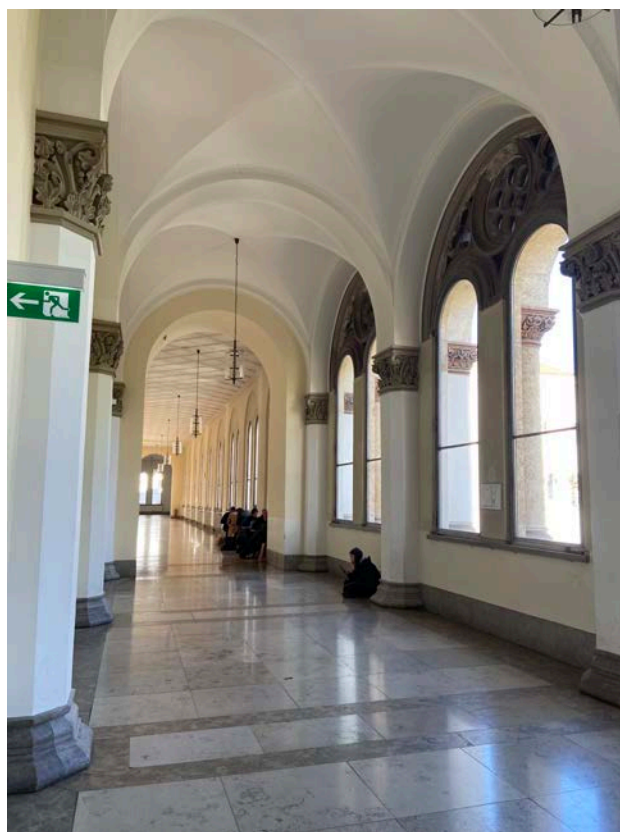
（左：開學典禮、右：學校走廊）