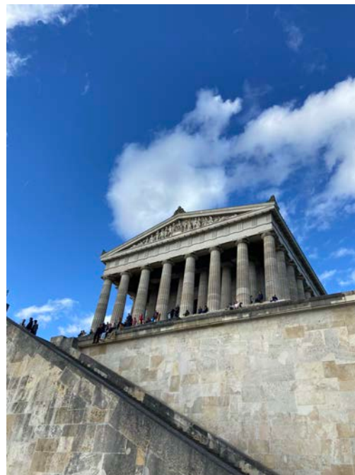
(左：班堡，右：雷根斯堡)