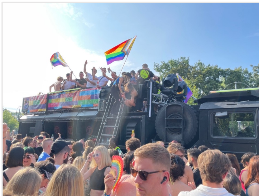
▲ Christopher Street Day

我自己覺得在 FU Berlin 學期初給交換學生的城市導覽很棒，不但可以讓學生打成一片，國外學生也可以對當地的環境快速的認識。我想政大如果也安排有興趣的在校學生來協助這樣的導覽，不但能得到與外國同學的交流體驗，也是磨練外語的好機會，外國學生也可以更融入台灣的當地生活。