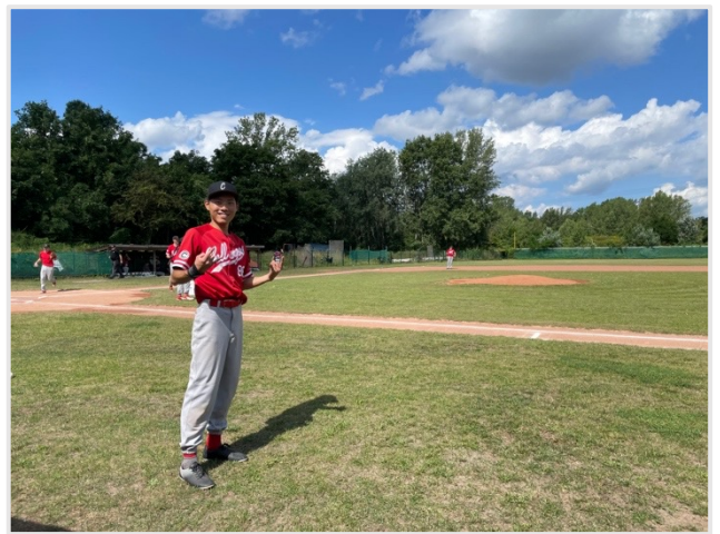
▲ SCC Berlin Challengers

我認為從自己有興趣或較擅長的領域，可以更容易的增加和當地人相處的機會，除了自己會比較有自信，大家的話題也好搭的上。認識和自己有共同嗜好的德國人或外國人，了解他們和我們的異同是我覺得很難得的體驗。舉例來說，加入這個棒球隊讓我打破了“德國人都是嚴肅、難熟、一板一眼”的刻板印象，不過也印證了他們對啤酒的至愛之情，因為他們的球具庫裡就有個冰箱，每次練完球還真的會喝上一瓶啤酒。