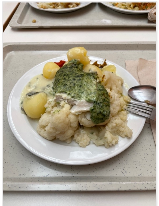
▲ Döner mit Brot & Mensa