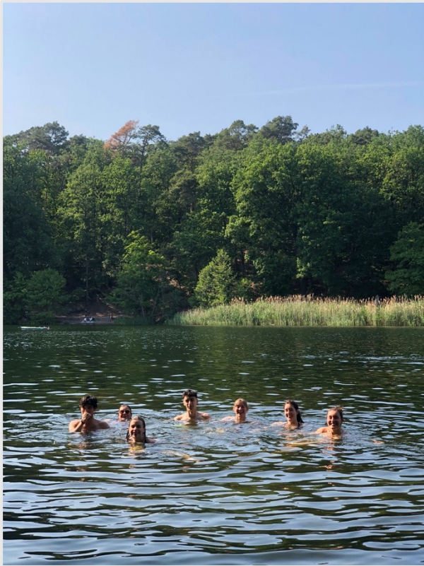
▲ 大家在 Schlachtensee 裡游泳

FU Berlin 的語言中心有提供語言交換學伴 (Tandem Partner) 的媒合平台，申請方式是上網填寫表單。我配對到一位父母從中國大陸移民來的大一男生，每個禮拜我們見面一次，用中文和德文聊天。因為他是土生土長的德國人，我跟著他增進口說和聽力的能力，學習一些德國與柏林的知識文化，他也會問我一些中文的用法，聽我分享關於台灣的一切。我覺得申請學伴是很棒的學習機會，還可以交朋友，所以個人很推薦去申請看看。