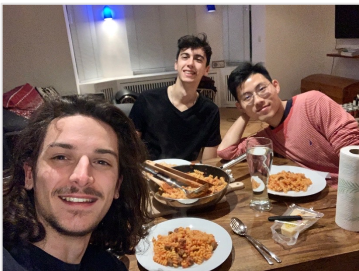
▲▶ 自己買來煮真的便宜又好玩