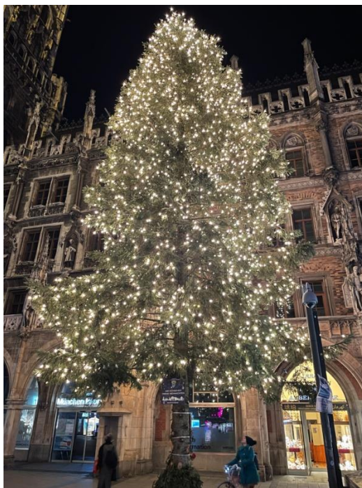
圖 1: 慕尼黑市政廳前的聖誕樹

慕尼黑大學有一個叫 MESA 的社團，主要是辦一些活動讓交換生可以跟彼此互動，同時認識慕尼黑以及慕尼黑附近的環境。我個人參加這種活動的次數不多，主要都是跟身邊認識的人行動。上學期因為疫情的緣故沒有實體上課，也沒有舉辦很多活動，所以很難認識到新朋友。下學期的時候很幸運的在課堂上認識到一位已經在慕尼黑住四年的留學生，之後很常跟他約吃飯，探索慕尼黑的各種地方。