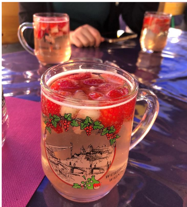
→和朋友一起參加維爾茲堡的 Weinfest，在攤販購買的草莓酒非常好喝!