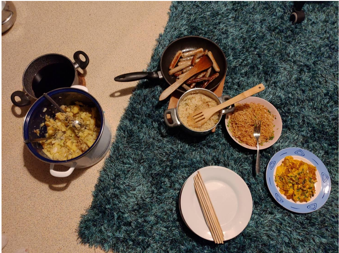
→和同行學妹及德國朋友一起做的食物交流會~