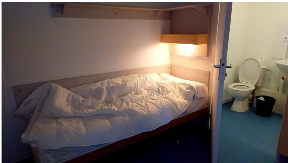
圖(六) 套房臥室與獨立衛浴