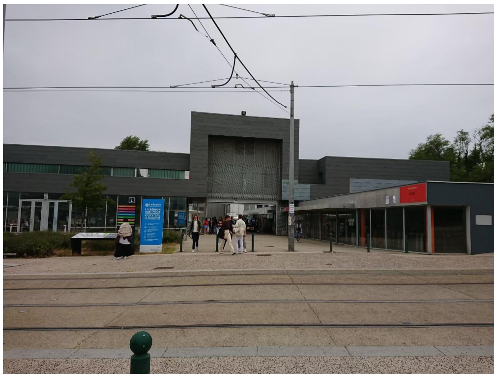
圖(三) PDA (Porte des Alpes) 校區