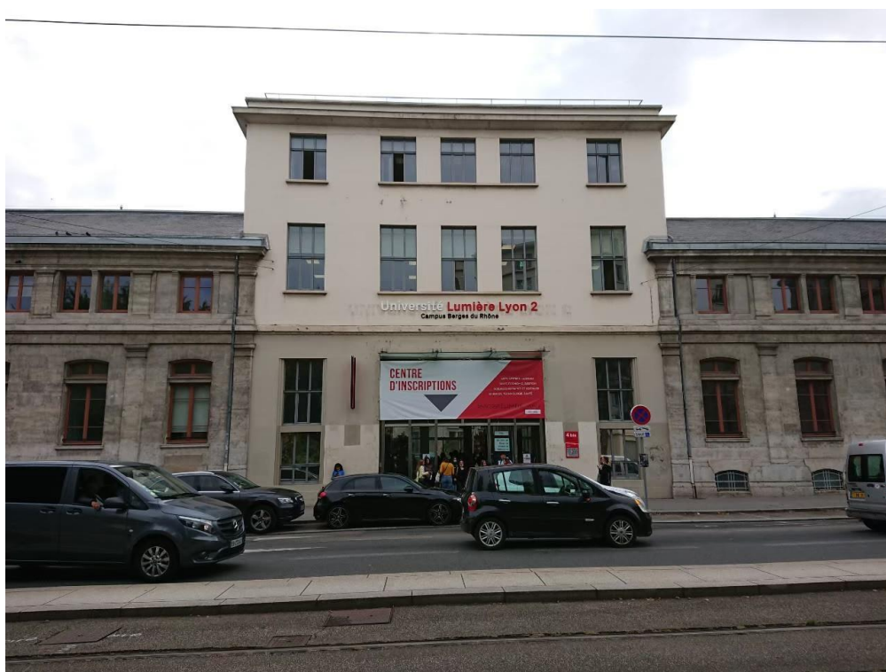
圖(二) BDR (Berges du Rhône) 校區