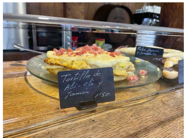
圖：學校學餐的烘蛋Tortilla