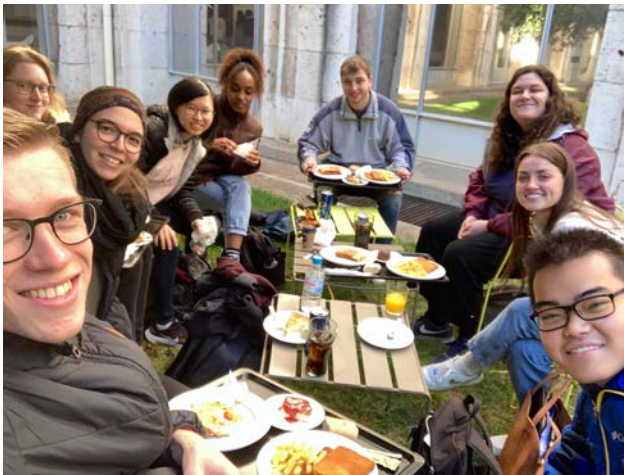
圖：與電影課同學吃飯交流照

回顧這次將近一年的交換旅程，我很慶幸自己誤打誤撞來到了自己很喜歡的交換城市 Pamplona。因為 Pamplona 不像馬德里和巴賽那麼大，所以多了很多機會可以與當地人與在學校認識的交換學生、老師深度交流。縱使在政大已經學了四年西文，但真正要跟當地人互動，也需要鼓起勇氣開口說西文。尤其我第一學期住宿是跟當地奶奶房東一起居住，因此多了很多機會每天練習西文，也藉機了解西班牙許多文化面向。譬如：西班牙人吃飯與生活習慣，對乾淨的定義是「乾」等。除此，因為 UNAV 是個很國際化的大學，不管是上語言課還是系所課程，都有相當多機會和世界各地的人交流。因此，我覺得敞開心胸，不管是用英文、西文都好，勇敢跨出舒適圈接觸新事物和新朋友。