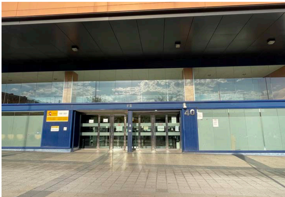
圖：Pamplona 外事局 Avenida de Guipúzcoa, 40

建議一拿到簽證後，就開始預約申辦西班牙居留證。要事先從網路預約成功，才能到當地外事局或外事警察局辦理。除此，根據所去的西班牙自治區，有的滿好預約，有的則要看運氣搶空擋。如果是前往西班牙那瓦拉大學（以下簡稱UNAV）的同學，則有兩種選項。UNAV國合處會統一幫需要居留證的交換學生於九月開學中辦理，好處即是全權由學校負責預約外事局與分發按指紋的時間，但缺點即是無法自行選擇實際按指紋的日期，由外事局統一發信件告知（通常為10月中）。親自前往外事局後，仍要等30天過後，才能正式領到居留證。因此，建議想要及早拿到居留證的UNAV交換同學，可以自行決定要不要跟著學校辦理。如果想省時間的話，滿推薦會西班牙文的同學，自行網路預約，並於抵達Pamplona後盡快處理。