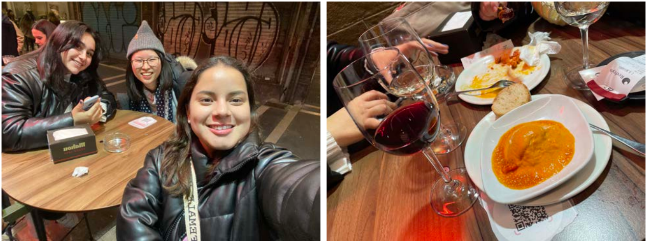
圖：和朋友在舊城區享受juevintxo

Pamplona是一個讓人放鬆、安全且安靜的城市，加上生活機能佳、綠地眾多。城市類似大學城的關係，因此總能在學校或舊城區感受到年輕活力。通常同學們會逗趣自嘲說 Pamplona的人口組成要不是學生，就是退休老人，是個相當宜居的城市。若是學西文的同學，更會覺得自己多了很多練習實戰西文的機會。Pamplona每週四在舊城區都有一個juevintxo的活動，舊城區狹窄街道也會充滿相聚、閒聊的人群，用酒和pinchos (西班牙北部稱呼tapas的方式，為一種小點) 享受人生、歡慶即將到來的週末。