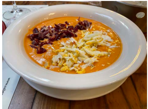
圖：西班牙南部安達盧西亞特色冷湯Salmorejo

除了待在 Pamplona 的日常，我也很鼓勵交換學生在西班牙各個自治區旅遊，因為你會發現西班牙北、中、南差異很大，去不同自治區有如出國一樣。假如又是歐西交換的同學，更會覺得透過旅遊，就像是重新為自己複習了西班牙文化概論的課。縱然在 Pamplona 交換的缺點即是與其他西班牙城市的交通連結較少，但我還是鼓勵在旅遊預算與時間允許下，好好安排旅遊計畫，發現西班牙不同之美、吃盡西班牙特色小吃。