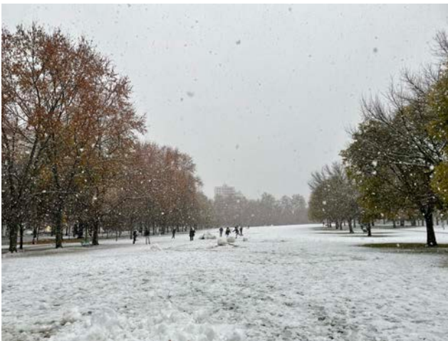
圖：Pamplona十一月底下雪場景

Pamplona是個氣候詭異的城市，去年前往當地之前，一直被提醒會很常下雨，要記得隨時攜帶雨傘；然而我實際抵達當地的第一學期，反而下雨下得比在政大文山區少。然而，還是建議帶一把好傘出國，不過要注意風也挺大的；若雨不大的話，當地人通常是穿一件防風防水外套。除此，怕冷的同學，要記得多準備一些長袖衣服，通常九月底、十月初就會開始變冷，夏天衣服反而不用帶太多；加上在西班牙北部生活，擁有一件好穿脫的大衣也很重要，因為11月冬天開始，室內通常會開暖氣，切記要習慣洋蔥式穿法。