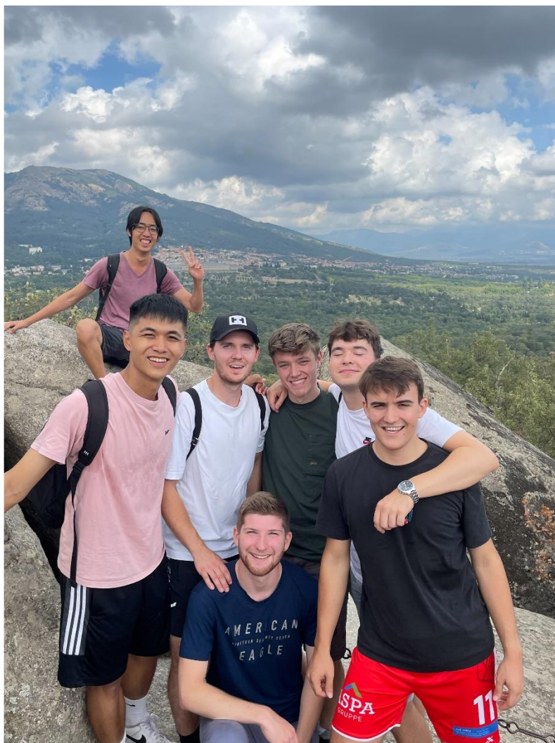
和卡三其他外籍交換生一起健行