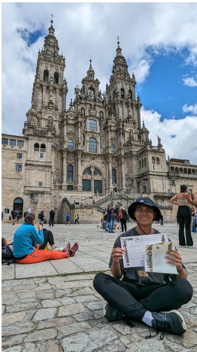
西班牙聖地牙哥 (Santiago) 大教堂: 朝聖之路的終點