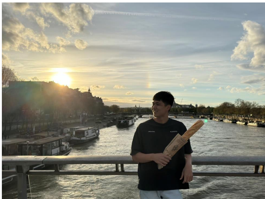
法國巴黎 (Paris) 塞納河