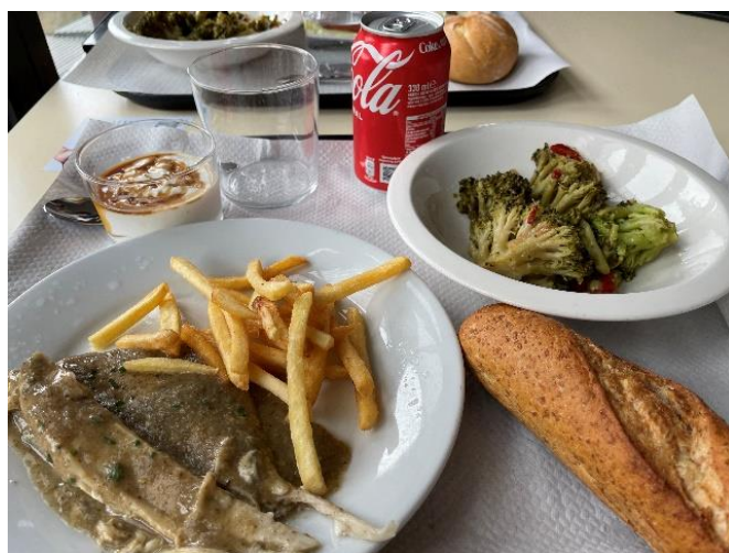
卡三學餐的當日特餐 (Menú de día)