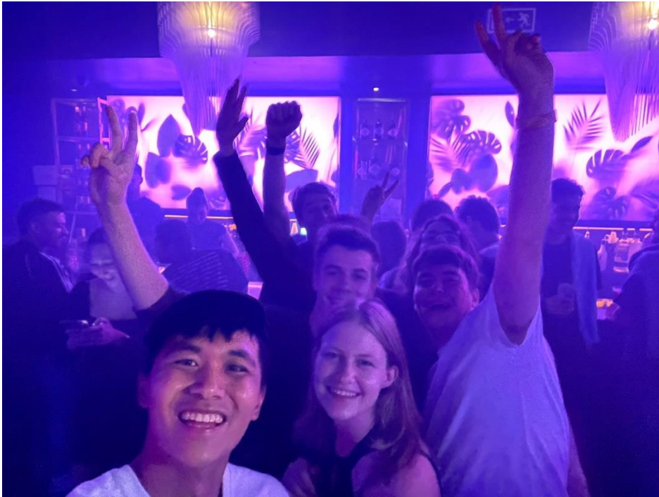
和外國朋友到夜店喝酒跳舞