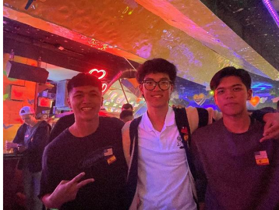
參加 Meet & Speak 語言交換