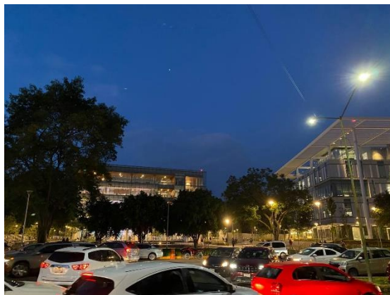
早上七點左右的學校

選課因為是開學前大概一個月就會開始，因此都是透過網路的方式，就有遇過系統大塞車當機而選課日程延後的狀況，學校一開始就會創whatsapp群組，有事情都會在裡面宣布，有任何狀況就關注群組或信箱看學校怎麼安排就好。