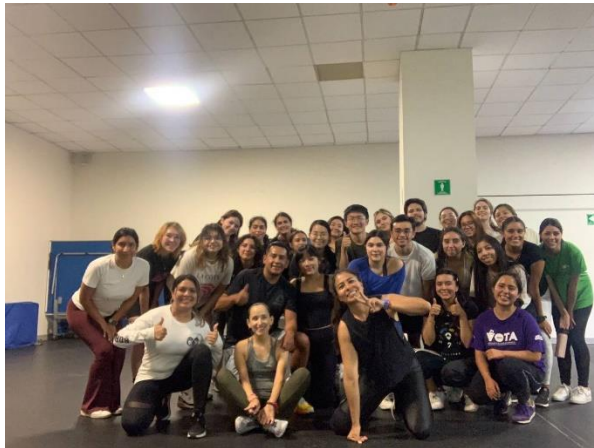
LIFE的BODY PUMP和皮拉提斯課程