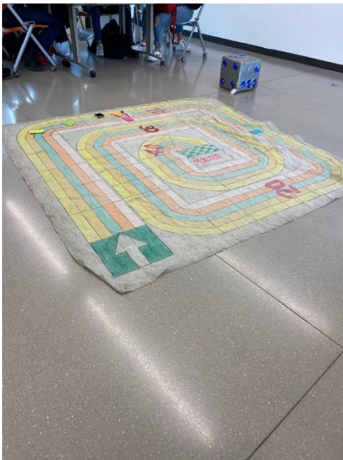
行銷課的期末考方式 是大富翁，並且以小組方式作答